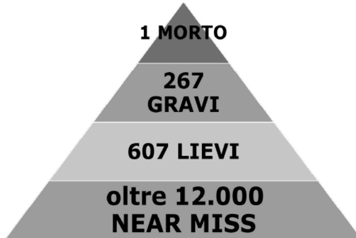
Figura 2: Piramide Heinrich-Bird (2017-2019) – Attività di Raccolta, Trattamento e Smaltimento dei Rifiuti; Attività di Risanamento (Ateco E38 e E39)

Fonte: Inail - Banca dati Statistica- dati aggiornati al 31 ottobre 2022