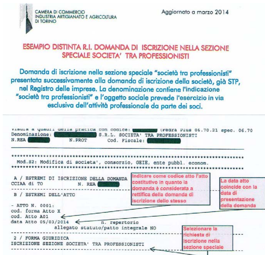
Figura 2: Esempio di compilazione Mod. S2

Si raccomanda , stante la specifica procedura di iscrizione seguita dal Registro delle Imprese di Torino, di indicare come inattiva la STP fino al momento in cui verrà richiesta , al medesimo Registro, l'annotazione dell'avvenuta iscrizione nella sezione speciale dell'Albo professionale.